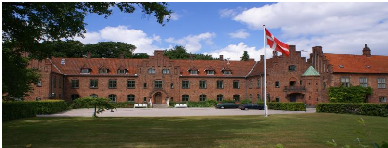
ROSKILDE KLOSTERS HOVEDBYGNING ER BYGGET 1550-1565

INDBYDER TIL SENSOMMERTUR TIRSDAG DEN 3. SEPTEMBER KL. 11.00 MED RUNDVISNING PÅ ROSKILDE KLOSTER SANKT PEDERS STRÆDE 8E, ROSKILDE